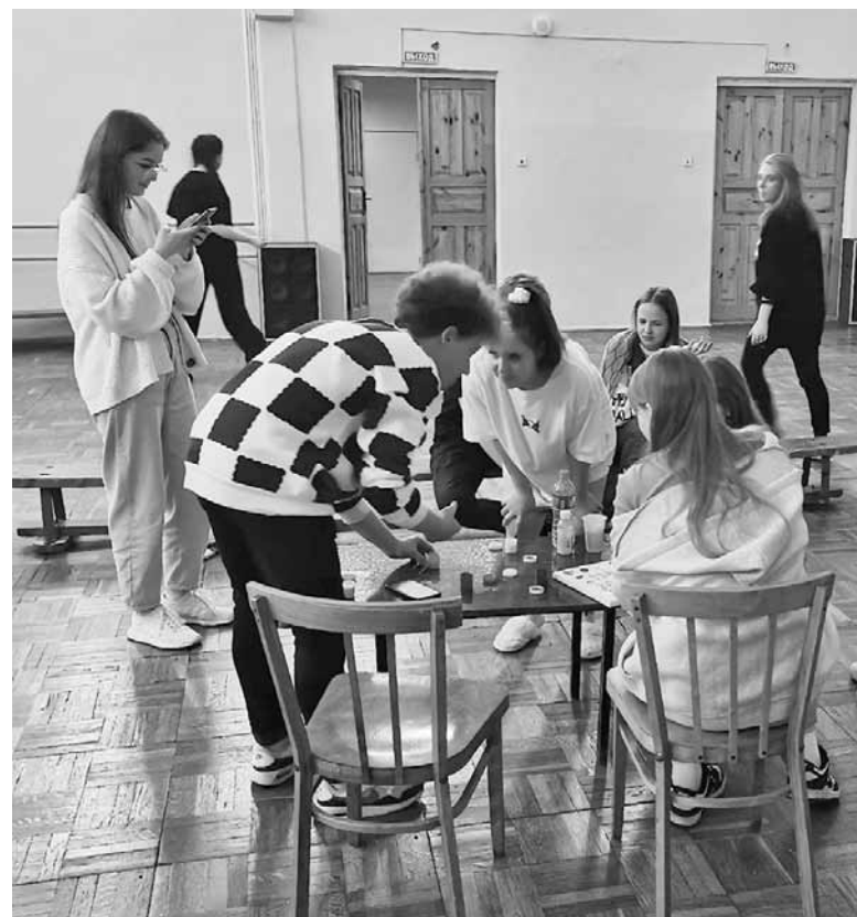
Было много интересного, в том числе... консультация по русскому языку!