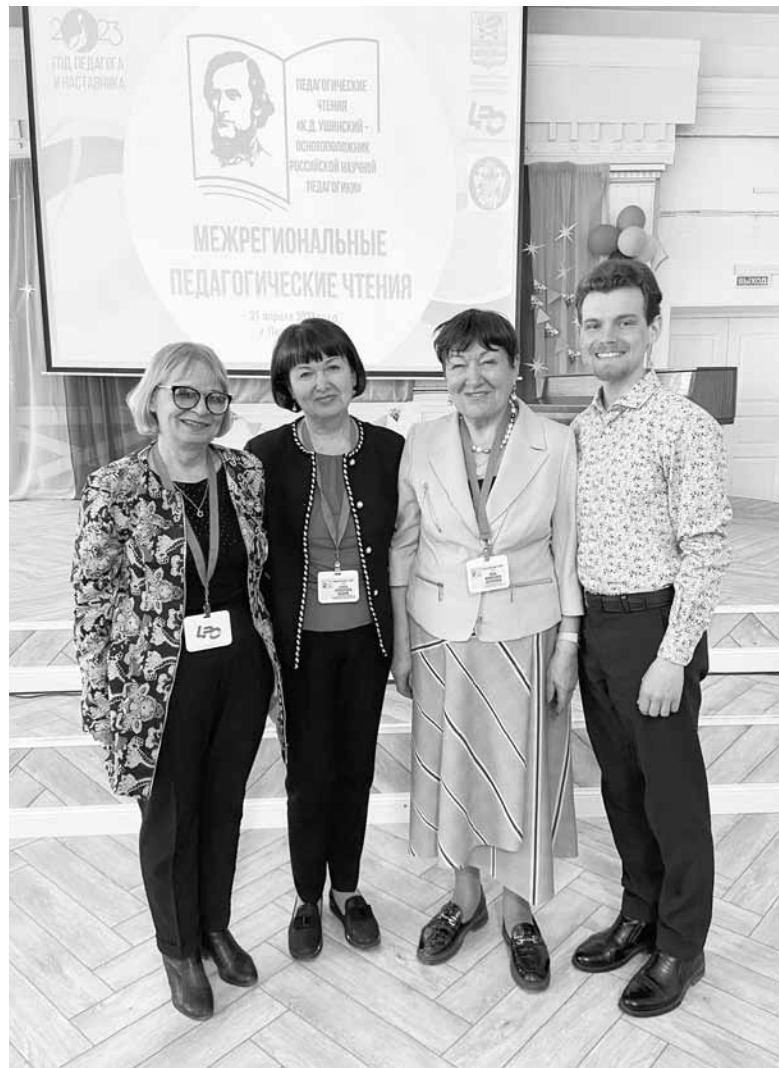
Участники, организаторы и гости конференции уверены в актуальности наследия Константина Ушинского

сти учреждений в Российской психолого-педагогической олимпиаде школьников имени К.Д.Ушинского, использовании наследия в допрофессиональной педагогической подготовке школьников и системе поддержки начинающих педагогов в Петрозаводске, дополнительно обсуждались вопросы педагогической деятельности: новые ценности и переориентация.