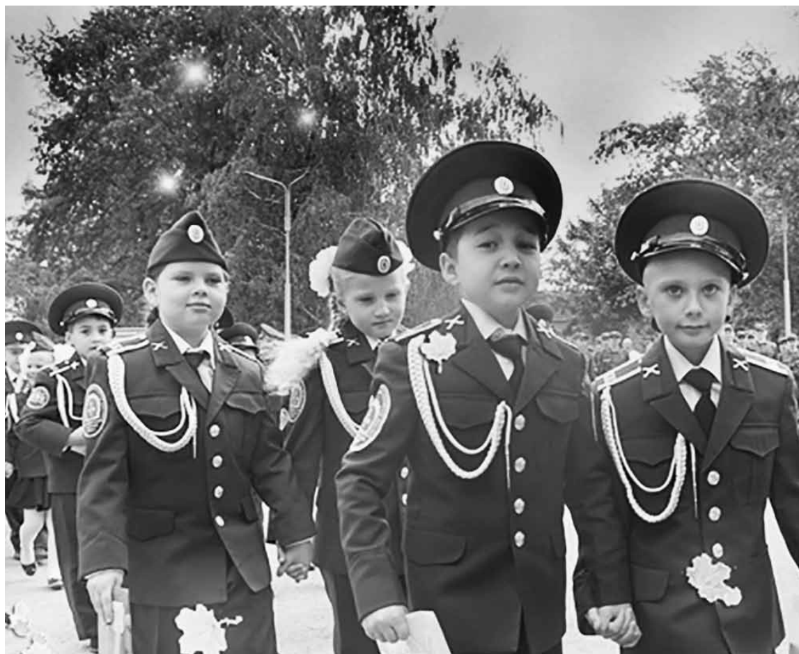
Выправка кадет в строю вызывает восхищение

неизменно восхищаются подготовкой и выправкой кадет. О выпускниках отзываются так: «Ребята хорошо развиты, отлично воспитаны». А одна мама на выпускном вечере вы-