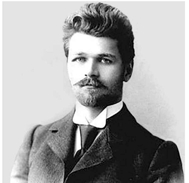
Станислав Теофилович ШАЦКИЙ

- подчеркивал педагог, - что простая пересадка заграничных образцов на русскую почву имеет мало цены. Для подлинного успеха в учебе и воспитании, по его убеждению, необходимы активное творческое знакомство детей с миром и его освоение, которое невозможно без оригинальных идей и замыслов, рожденных на