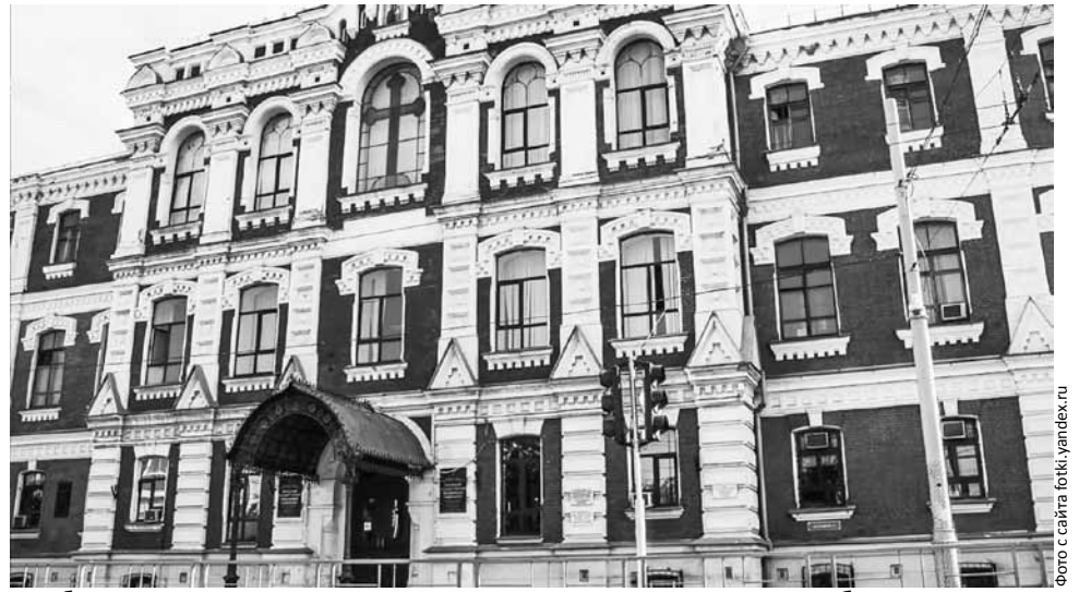
В Кубанском медицинском университете создали уникальные разработки