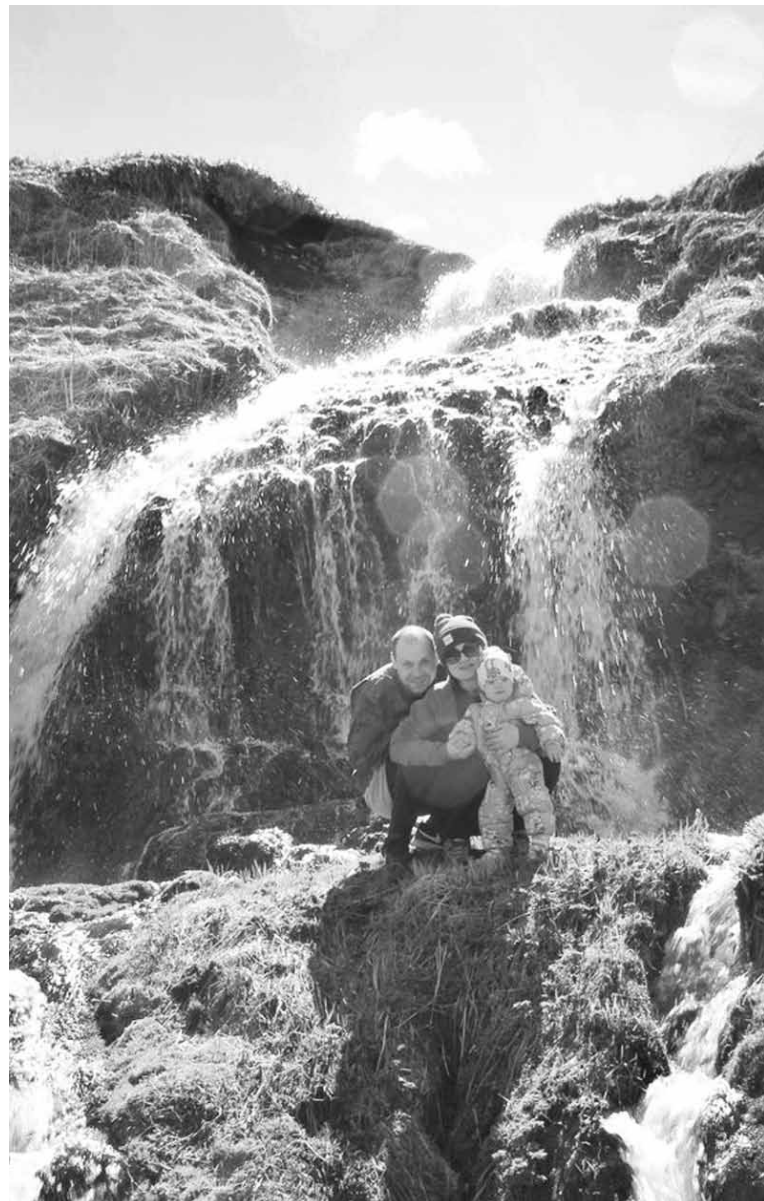
Семья всегда рядом

ховный фундамент - любовь и уважение. Говорят, когда пятеро детей растут в семье, родители отдыхают, ведь старшие ребята все научены, заботятся не только о себе, но и о братьях и сестрах. Надо ли говорить, что, подрастая, глубоко в душе маленькая девочка хотела, чтобы и у нее в будущем все было почти как в родной семье.