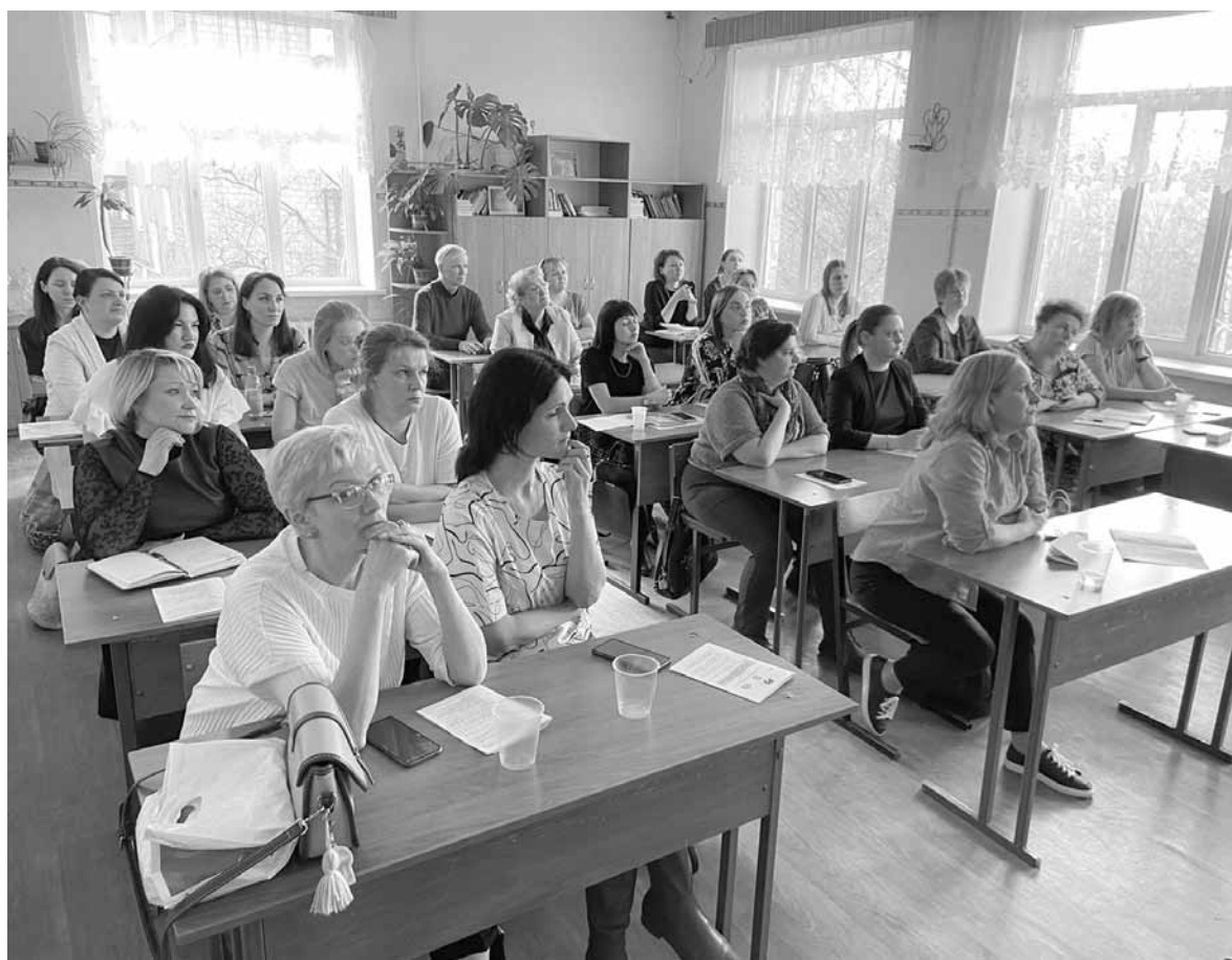
Пленарное заседание продолжилось работой секций

Педагоги Ломоносовской гимназии провели экспресс-рефлексию мероприятия, ознакомили таким образом с оперативной рефлексивной технологией на основе применения современных технических средств (QR-код). К моменту завершения чтений они обнародовали ее результаты: все 45 участников опроса положительно оценили состоявшееся событие, две трети из них высказали намерение применить возникшие идеи и предложения в своей профессиональной деятельности.