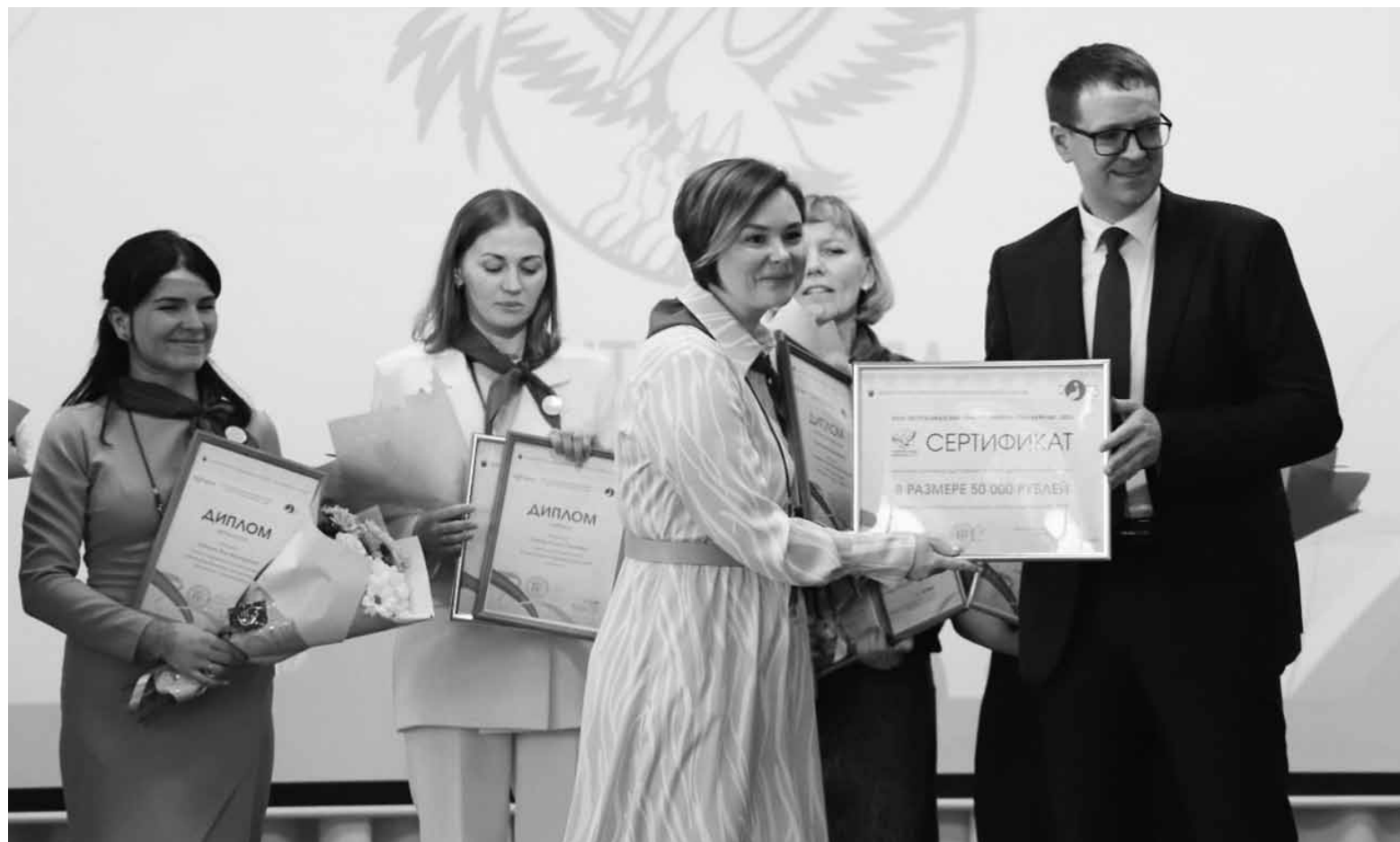
Торжественное вручение сертификата на 50 тысяч рублей

вать задачи в поставленные сроки, не отвлекаться на несущественные дела. В-третьих, наглядность данной таблицы не позволяет выпустить задачу из фокуса внимания класса и классного руководителя. И последний, четвертый, плюс, на мой взгляд, самый значимый. Это ощущение контроля над собственной жизнью, которое помогает ребятам чувствовать себя значимыми, а главное - снижает уровень стресса.