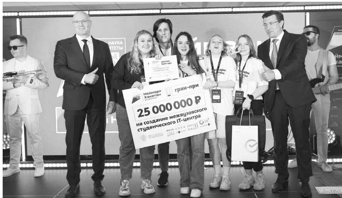
Дмитрий ЧЕРНЫШЕНКО (слева) вручил сертификат на 25 миллионов рублей победителям студенческого хакатона

По мнению главы Минпросвещения, опыт православных школ в вопросах воспитания молодежи может быть полезен и другим общеобразовательным организациям. По итогам форума все пожелания будут обобщены и систематизированы. Также Сергей Кравцов поддержал предложение проводить форум ежегодно.