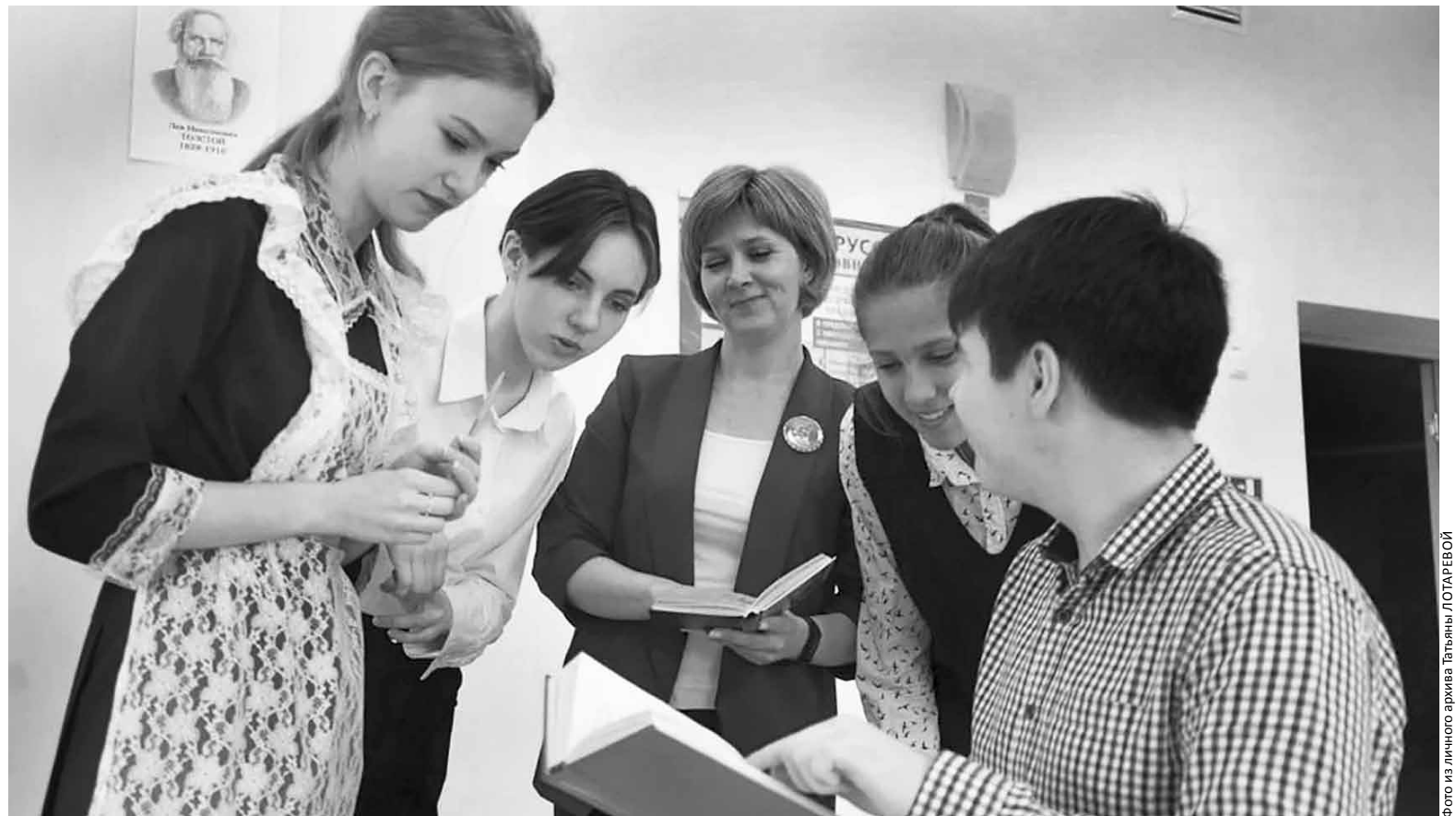
Таких уроков дети еще не видели!